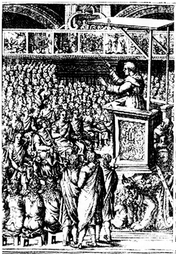
Slika 2: Pridigar

Tudi ignacijanska metoda je temeljila na vizualnem: sveti Ignacij je sledil navodilom reformirane cerkve (25. zasedanje tridentinskega koncila, 1563) in v uvodnem delu svojih Duhovnih vaj namenil precej pozornosti »kontemplaciji ali meditaciji vidnih stvari [...], ko z očmi domišljije gledamo konkreten kraj, kjer je predmet kontemplacije« (1991: 23) (Slika 3).