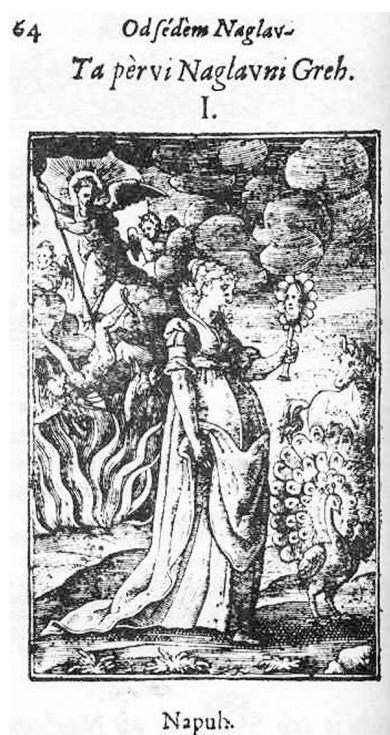
Slika 4: Čandkova priredba Kanizijevega Katekizma

Pokristjanjevanje na Slovenskem je z ustnim sporočanjem neposredno povezano tudi s »pismom brez pismenk«; 7 pomen ustnega (spovedi) je močno poudarjen tudi v Brižinskih spomenikih. Ljudsko slovstvo je ustno; pri dramskih besedilih (jezuitskih in kapucinskih verskih igrah, duhovnih igrah, Škofjeloškem pasijonu) je povezava med ustnim in podobo očitna. Tudi ena izmed konstant starejše slovenske književnosti, pridiga, ki doživi svoj vrhunec ravno v obdobju reformacije, predvsem pa protireformacije in baroka, je ustni žanr, kar je povsem v skladu s tridentinskim koncilom, ki je podpiral rabo pridige, kar je razvidno tudi iz zapovedi škofom in dušnim pastirjem, da morajo govoriti vernikom vsako nedeljo in za praznike; v velikonočnem času in v adventu po možnosti vsak dan. O tem, da gre za zapis